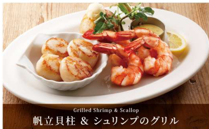
Grilled Shrimp & Scallop