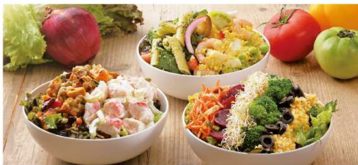
Fresh Salad & Deli Salad Bar