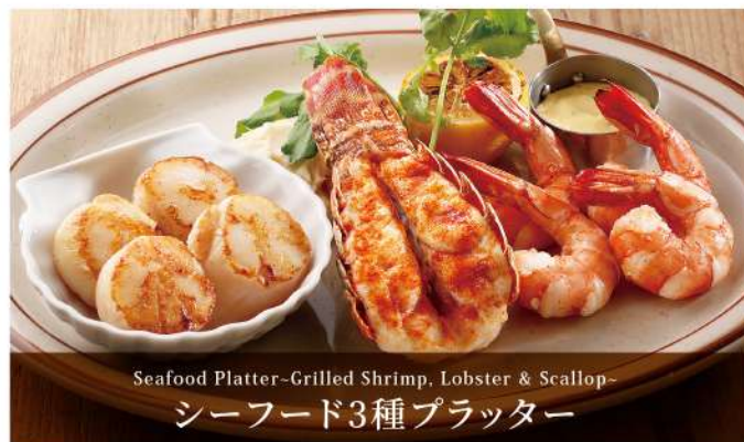
Seafood Platter-Grilled Shrimp, Lobster & Scallop-