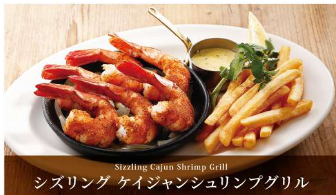
Sizzling Cajun Shrimp Grill