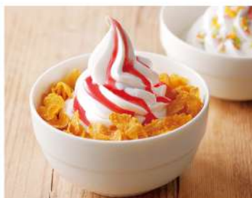
Fruits & Dessert Bar