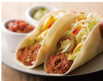
Hot Food Bar